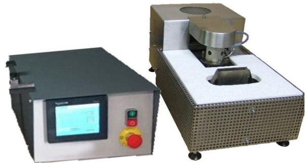
MV400 boitier avec écran tactile