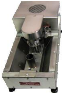
MV400 boitier standard