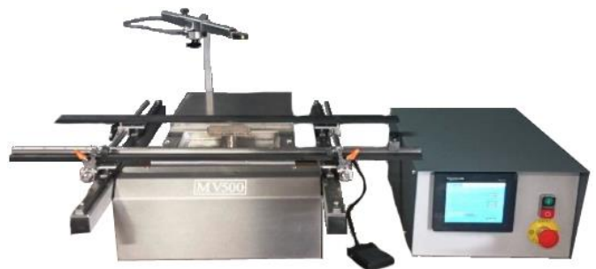
MV500 boitier avec écran tactile